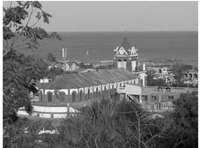
La cathédrale Saint-Louis-Roi-de-France de Jérémie.