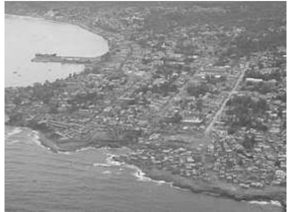
La cité des Poètes