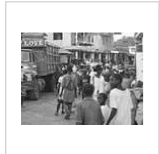
Centre de Jérémie (2007)