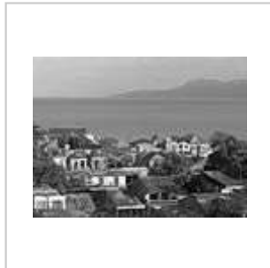
Centre de Jérémie (2006)