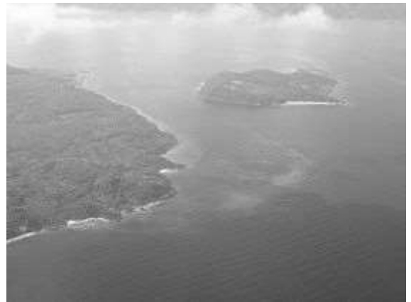
Vue aérienne des Cayemites en 2007